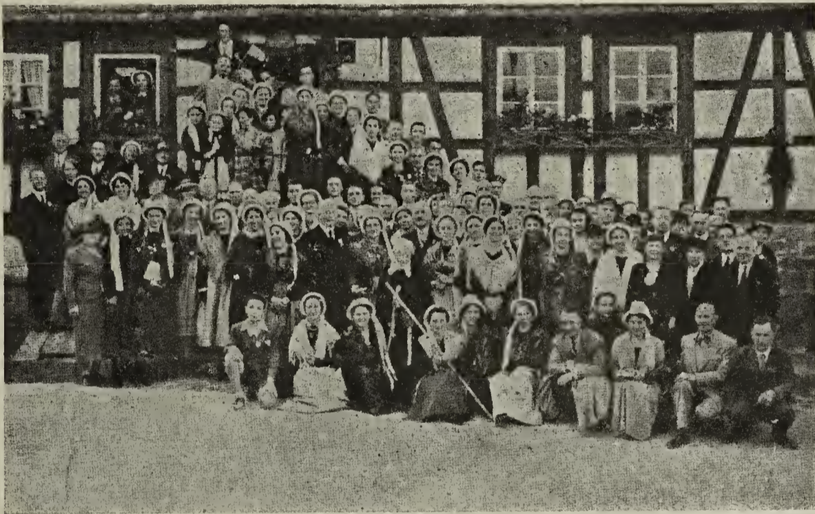
↳ Peregrinación de Valdenses de los Valles (julio 1939) frente a la antigua casa de Arnaud en Schönenberg, hoy transformada en "Museo Valdense"

En estos días los descendientes Valdenses de Alemania, celebran el 250 aniversario